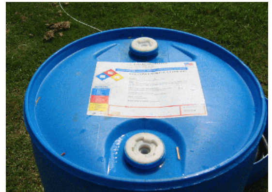
荷姿: プラスチック製ドラム缶(480 lbs/ドラム)

帯水層の酸性度を中和する場合、取り扱う中和剤を懸濁状態に維持することが重要なポイントです。しかし、数多くの緩衝剤は、透水損失(permeability loss)が高いため、隅々まで製品が浸透しにくいという欠点が指摘されてきました。EOS Remediation は酸性帯水層における原位置バイオレメディエーションを成功させるため、 AquaBupH を開発してきました。本製品は他のコンディショニング製品と比べ、効果が優れている他に、取り扱い、メンテナンス、貯蔵方法の容易性さらには製品の安全性についても優れていると各方面から評価されております。